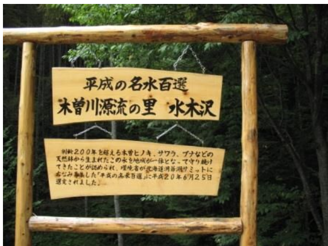
ハイキング客に人気上昇中