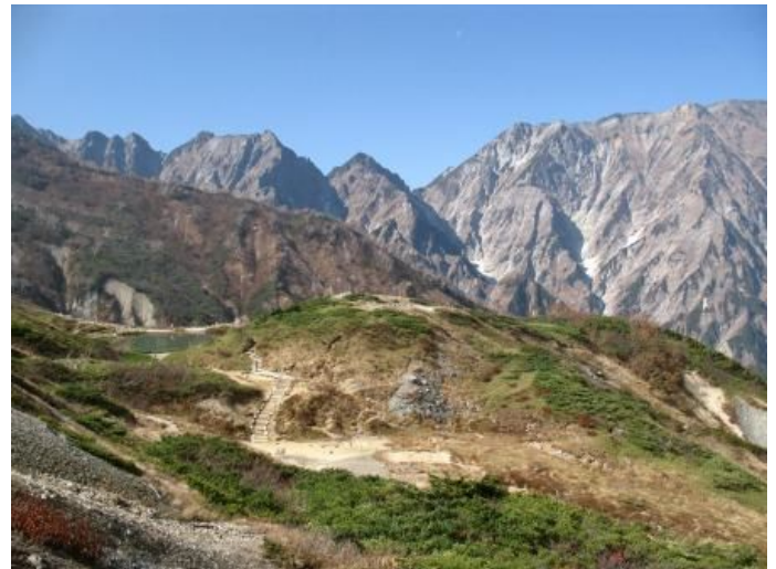
八方池と不帰の剣