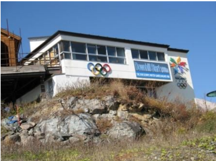
長野五輪のスタート地点