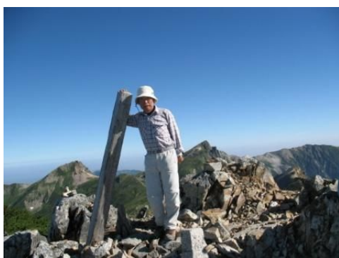
白馬鉢ヶ岳山頂にて。右は白馬岳。 左は旭岳です。

8/22（日）快晴。 5：35～6：45 杓子岳（2812M）6：52～7：45 鉢ヶ岳（2903M）8：10～8：30 分岐～9：57 白馬鍾温泉（入浴、300円）11：00～13：00 小日向のコル 13：05～14：06 林道～14：20 猿倉 14：45～（バス）15：10 八方 15：15～16：00 自宅 総走行距離 74KM。