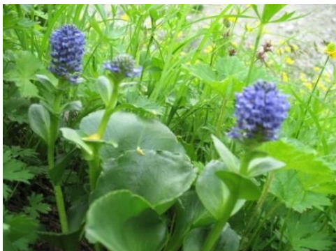
思わぬ所にウルップソウが。白馬やり温泉下

前回登頂しなかった杓子岳山頂に向かう。たいした標高差でないのに最近体が重い感じ。足も重ったるい。前後には登山者がチラホラ続く。人気のコースだ。鑓ヶ岳からの眺望は最高！槍ヶ岳もハッキリ見える。ただ、東側は高妻山や雨飾山などが山頂部しか雲で見えない。20分も展望を楽しむ。この先鑓温泉側へ降りるともう展望は無くなるので。この天気なら「奥丸山」の方が良かったかとも思う。稜線と別れて大出原へ下る。お花畑が有名だがそんなには感じない。花は確かに多いが。クルマユリの群生は見事だが。鑓温泉はこれぞ正に「源泉掛け流し」。チョット熱めが欠点か。入浴している所の写真も撮ったが少し猥褻感があり「非公開」にする。反省。足湯も無料で利用できる。昼食は朝の食いだめが効いて、カロリーメイトですませる。少し下った「温泉下」付近のお花畑が良かった。何と不思議な事に「ウルップソウ」が数株咲いていた。