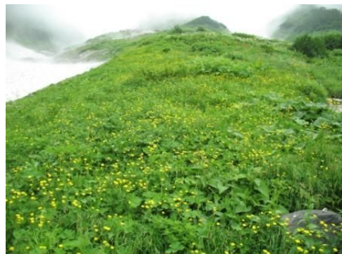
ミヤマキンポウゲの群生。鑓温泉下