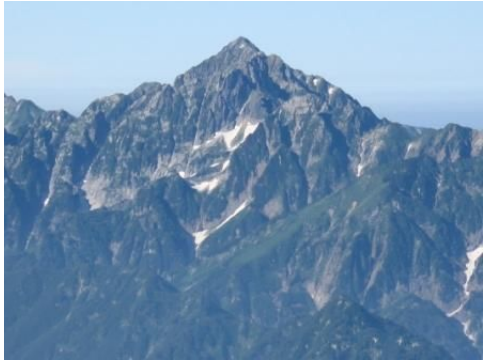
剣岳の雄姿。白馬鑓ヶ岳山頂より。