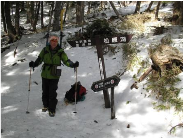
本沢温泉手前の分岐で