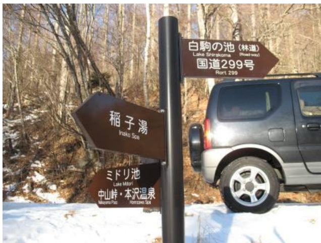
みどり池・唐沢橋のゲート駐車場