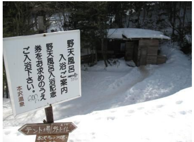
本沢温泉前、後ろは内湯です