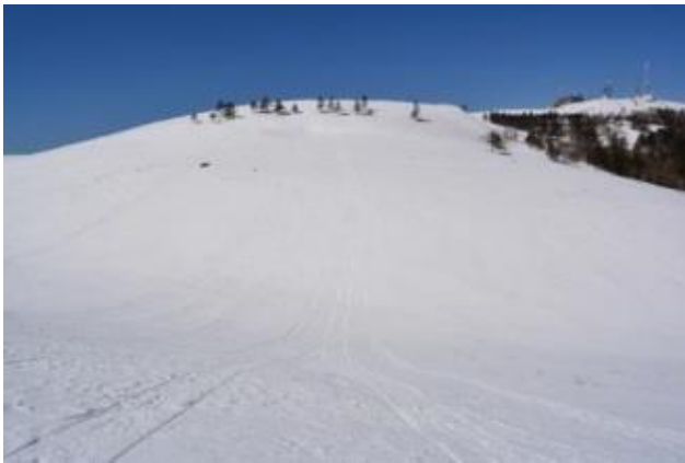
沢山のトレースあり