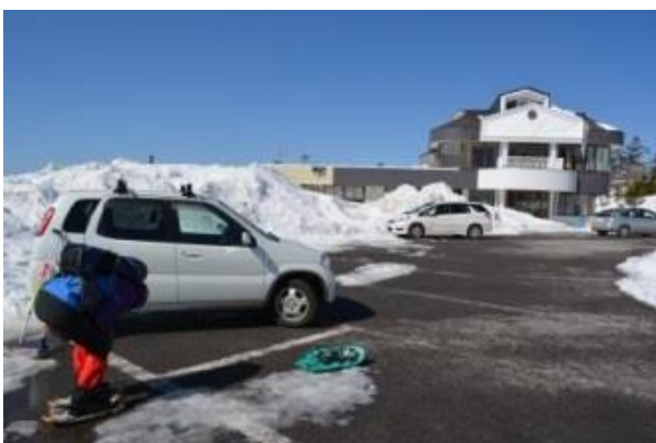
山本小屋手前の駐車場