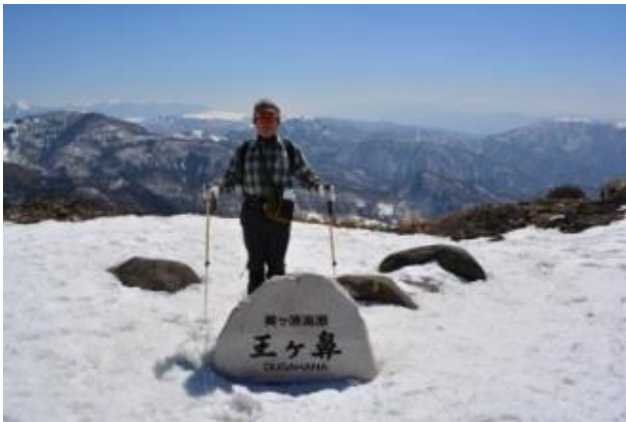
北アルプス、穂高・槍・常念方面の展望