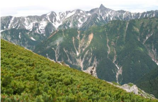
手前は喜作新道、北鎌尾根と槍