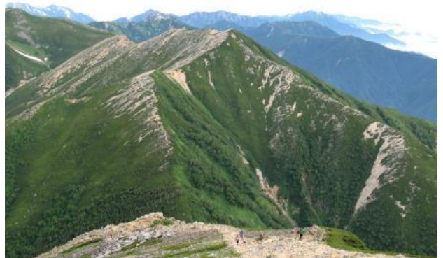
横通岳～燕岳方面、奥右から鹿島槍、白馬岳、岩小屋沢岳、 針ノ木岳、劔岳、立山