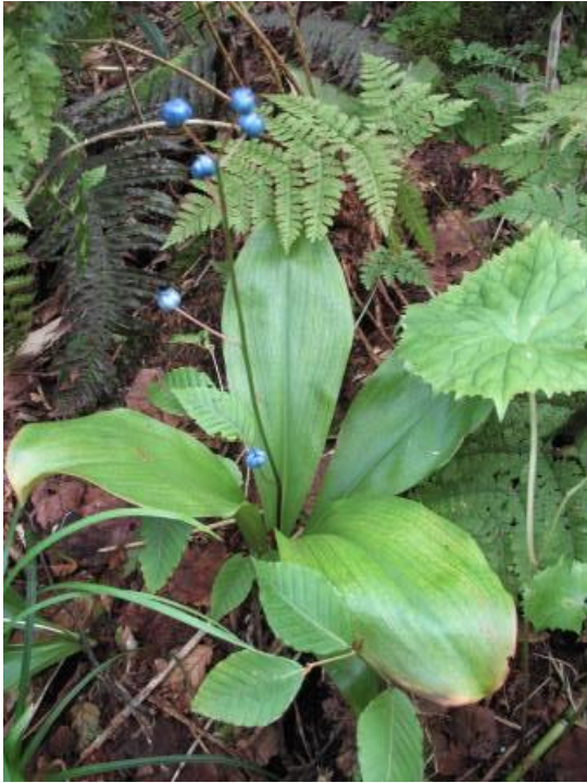
ツバメオモトの実