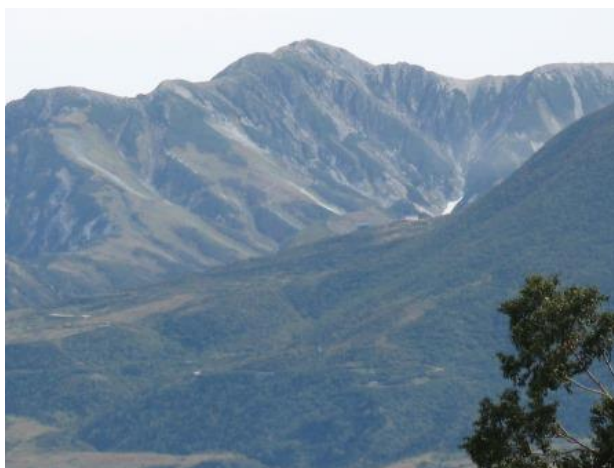
室堂へのバス道と大日岳を望む