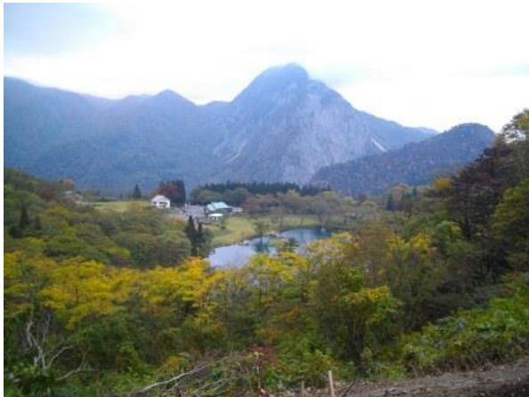
巨大魚の伝説 高浪の池と明星山