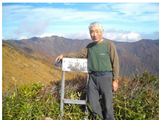
黒岩山山頂で珍しく笑い顔