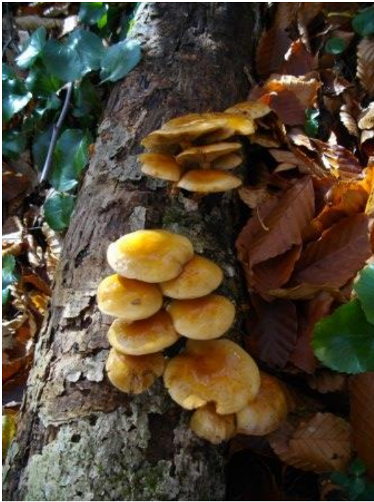
中俣小屋 帰路撮影