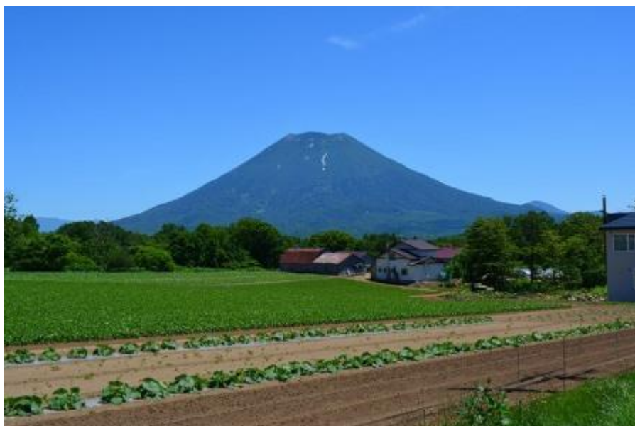
後方羊蹄山の雄姿