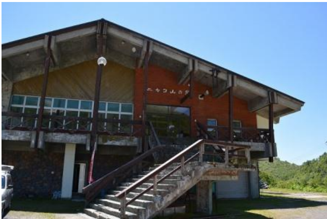
ニセコ山の家で入浴

古びた建物のニセコ山の家でユックリ入浴、誰も入浴客がない独り占めの長湯になった。