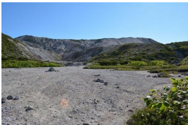
右イワオヌプリ山頂、中央ニセコアンヌプリ、左奥が後方羊蹄山